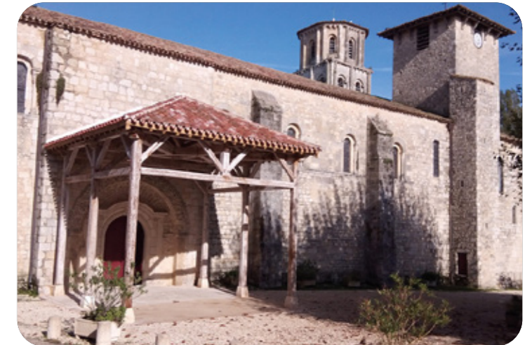
Porche couvert en 2019