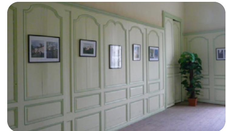
Le salon vert