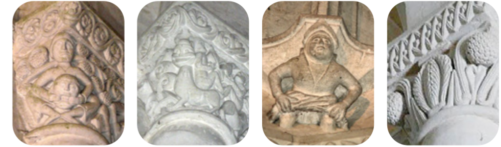
Détails des chapiteaux de l'abbatiale et au centre, un culot de l'abside