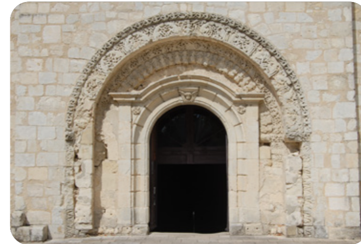
Porche de l'abbatiale

Le clocher sud est carré (XVI e siècle). Il abrite un escalier donnant accès au chevet surélevé et fortifié. Le clocher nord-est du XII e siècle, a deux étages : le premier carré, orné de colonnes engagées, reposant sur des culs de lampe ; le deuxième octogonal avec fenêtres cintrées.