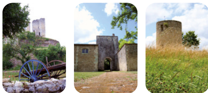
Le château (à gauche et au centre - ne se visite pas), et le moulin (à droite)

Connue depuis 1081, la forteresse occupe un site défensif naturel. Le donjon barlong du XI e siècle (tronqué de moitié durant la Fronde), les murs de la grande enceinte et le soubassement de la tour de guet sont du XI e siècle. La porte de la barbacane, dite de l'Audience, a remplacé au XIV e siècle la porte primitive. Le seigneur y exerçait son droit de Haute Justice. La seigneurie fut successivement aux mains des familles de Bourg et d'Albret puis du Chapitre de Saint André. La famille Abadie l'acquiert en 1958, famille dont la généalogie la lie à un certain... Amanieu VII d'Albret, seigneur du château au XIV e siècle.